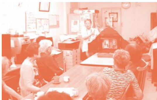
ボランティアさんを招いて紙芝居をされています。とても面白く、利用者さんも大笑いでした！